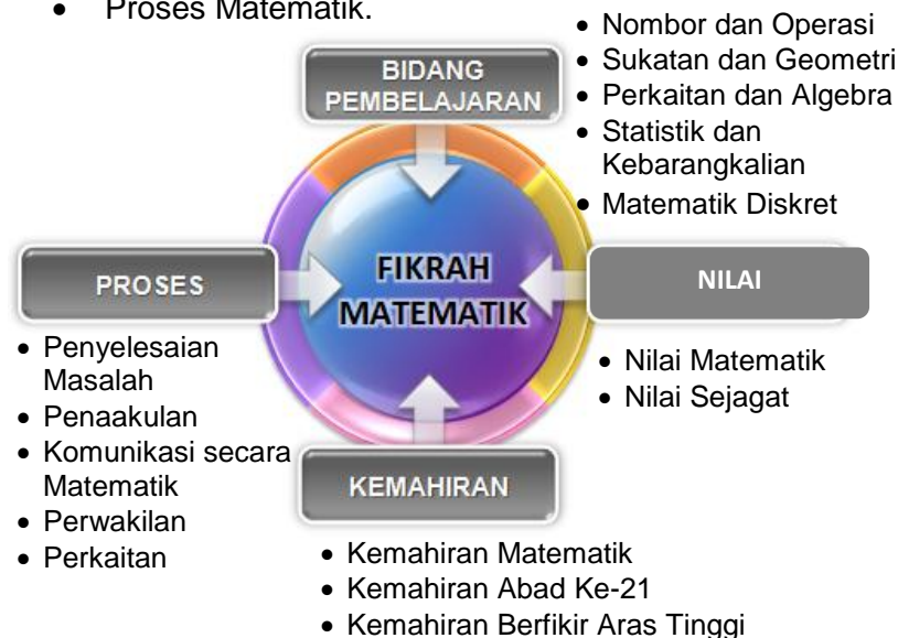
Rajah 2: Kerangka Kurikulum Matematik Sekolah Menengah